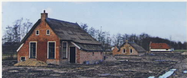
In Damwoude is met de schelpkalkcementmortel 1:5:10 een heel arbeidersdorp herbouwd, uit in containers opgeslagen delen.

bevestigt bovendien dat het bedrijf oog heeft voor duurzaamheid en milieu. "Dat zijn aspecten waar je als modern bedrijf niet omheen kunt. Maar daarnaast willen we alert inspelen op de wensen van onze klanten en de markt. Dat doen we met onze producten, maar eveneens met onze service. Een goede advisering en begeleiding van onze klanten staat daarin centraal, net zoals een efficiënte distributie via ons dealernetwerk bij de bouwmaterialenhandel. We bieden bijvoorbeeld onze mortels aan in zakken van 25 kilo, in big bags, maar er staan verspreid door het hele land ook al meer dan 2.000 Remix silo's. Zo willen we de klant in elk opzicht optimaal van dienst kunnen zijn." ■